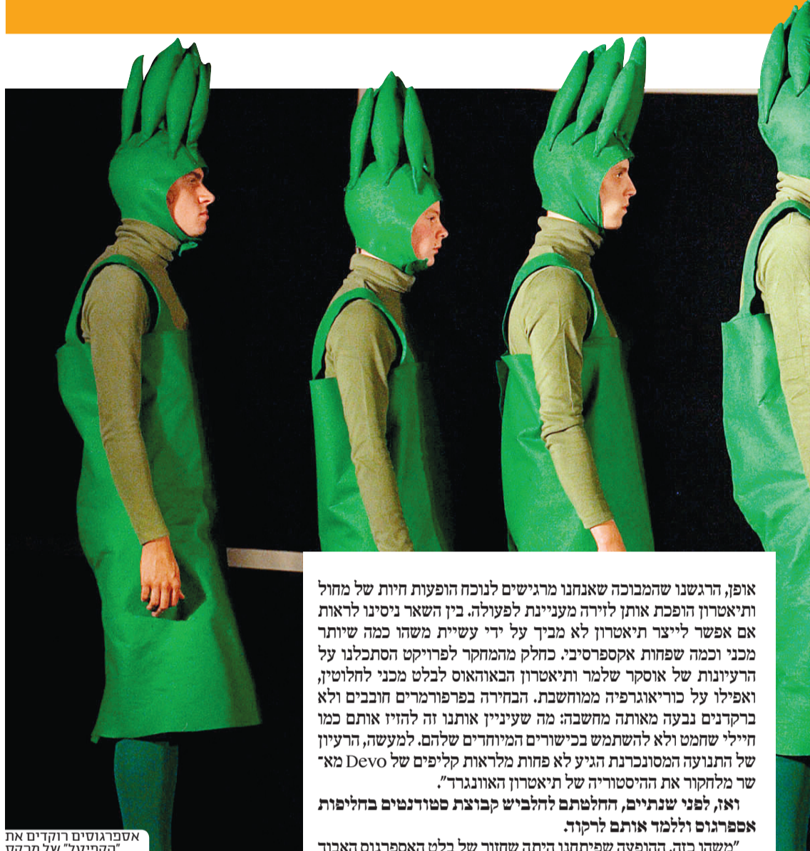
אספרגוסים רוקדים את "הקפיטל" של מרקס

אופן, הרגשנו שהמבוכה שאנחנו מרגישים לנוכח הופעות חיות של מחול ותיאטרון הופכת אותן לזירה מעניינת לפעולה. בין השאר ניסינו לראות אם אפשר לייצר תיאטרון לא מבין על ידי עשיית משהו כמה שיותר מכני וכמה שפחות אקספרסיבי. כחלק מהמחקר לפרויקט הסתכלנו על הרעיונות של אוסקר שלמר ותיאטרון הבאוהאוס לבלט מכני לחלוטין, ואפילו על כוריאוגרפיה ממוחשבת. הבחירה בפרפורמרים חובבים ולא ברוקדים נבעה מאותה מחשבה: מה שעניין אותנו זה להזיז אותם כמו חיילי שחמט ולא להשתמש בכישורים המיוחדים שלהם. למעשה, הרעיון של התנועה המסונכרנת הגיע לא פחות מלראות קליפים של Devo מאשר מלחקור את ההיסטוריה של תיאטרון האוונגרד.